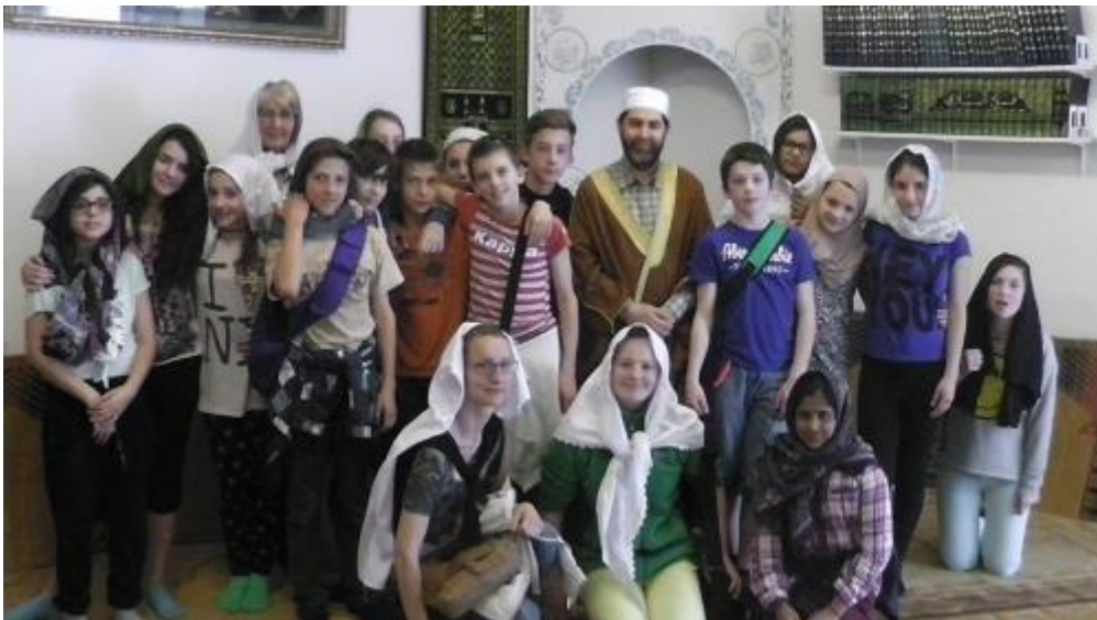
Visite à la mosquée. Les filles sont invitées à tenter le voile.

Le SEM a conclu à une implication possible de l'imam dans des activités terroristes. Il écrit que lors des contrôles effectués dans le cadre de l'octroi de la citoyenneté, de très nombreuses «indications concrètes ont émergé qui démontrent une implication présumée (de l'imam) dans le domaine du terrorisme islamique» , en particulier que le religieux «maintiendrait des liens avec des islamistes radicaux ou avec des personnes soupçonnées de participer à des activités liées au terrorisme islamique (...)» .